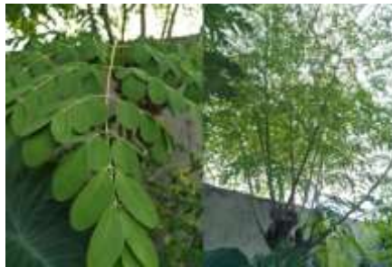
Gambar II.1. Pohon kelor

Penanaman kelor dapat dilakukan dengan metode penyemaian langsung dengan biji atau menggunakan stek batang. Daun kelor yang sudah 3 -6 bulan dapat dipanen yang ukurannya dapat tumbuh 1,5 hingga 2 meter. Untuk budidaya intensif, kelor dipelihara dengan ketinggian tidak lebih dari 1 meter yang bertujuan untuk produksi daunnya,. pemanenan dilakukan dengan cara memetik batang daun dari cabang atau dengan memotong cabangnya dengan jarak 20 sampai 40 cm di atas tanah (Krisnadi, 2015).