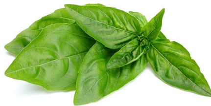
Gambar 2. 4. Daun Kemangi ( Ocimum sanctum L)

Daun kemangi merupakan salah satu tanaman obat keluarga yang banyak ditanam di Indonesia. Daun kemangi termasuk tipe daun tunggal, berwarna hijau sampai hijau kecoklatan. Daunnya bersilang, ujungnya runcing dan pangkal daunnya tumpul. Daun kemangi memiliki aroma yang khas, permukaan daunnya berambut halus dan daging daun tipis.