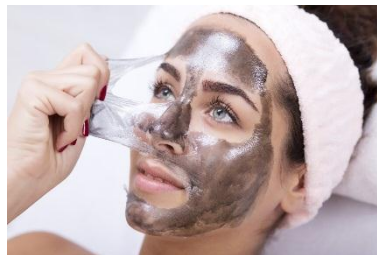
Gambar 2. 2. Masker gel peel off

Masker gel peel off merupakan salah satu masker yang praktis karena masker tersebut dapat langsung diangkat tanpa perlu dibilas oleh air setelah kering. Masker gelatin merupakan masker dengan bahan dasar bersifat jelly dari gum, tragacanth, latex, atau resin yang dikemas dalam bentuk tube ataupun pot. Masker tersebut membentuk lapisan transparan pada kulit dan dikelupas setelah kering. Cara kerja masker peel off berbeda dengan masker jenis lain. Ketika masker dikelupas maka kotoran serta kulit ari yang telah mati akan ikut terangkat (Ermavianti dan Ani, 2020).