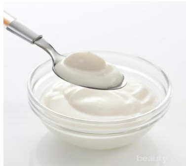
Gambar 2. 3. Yogurt

Yogurt merupakan susu fermentasi yang dibuat dengan menambahkan bakteri yang sesuai ke dalam susu sapi, hal ini biasanya diolah dengan cara pemanasan, kemudian inkubasi untuk menurunkan pH dengan atau tanpa perlakuan koagulasi. Contoh susu fermentasi yang paling umum adalah yogurt, krim dan buttermilk kultur, dan kefir. Yogurt sebagai produk susu kultur yang dibuat menggunakan bakteri Streptococcus thermophilus dan Lactobacillus delbrueckii subsp bulgaricus (Savaiano & Hutkins, 2021).