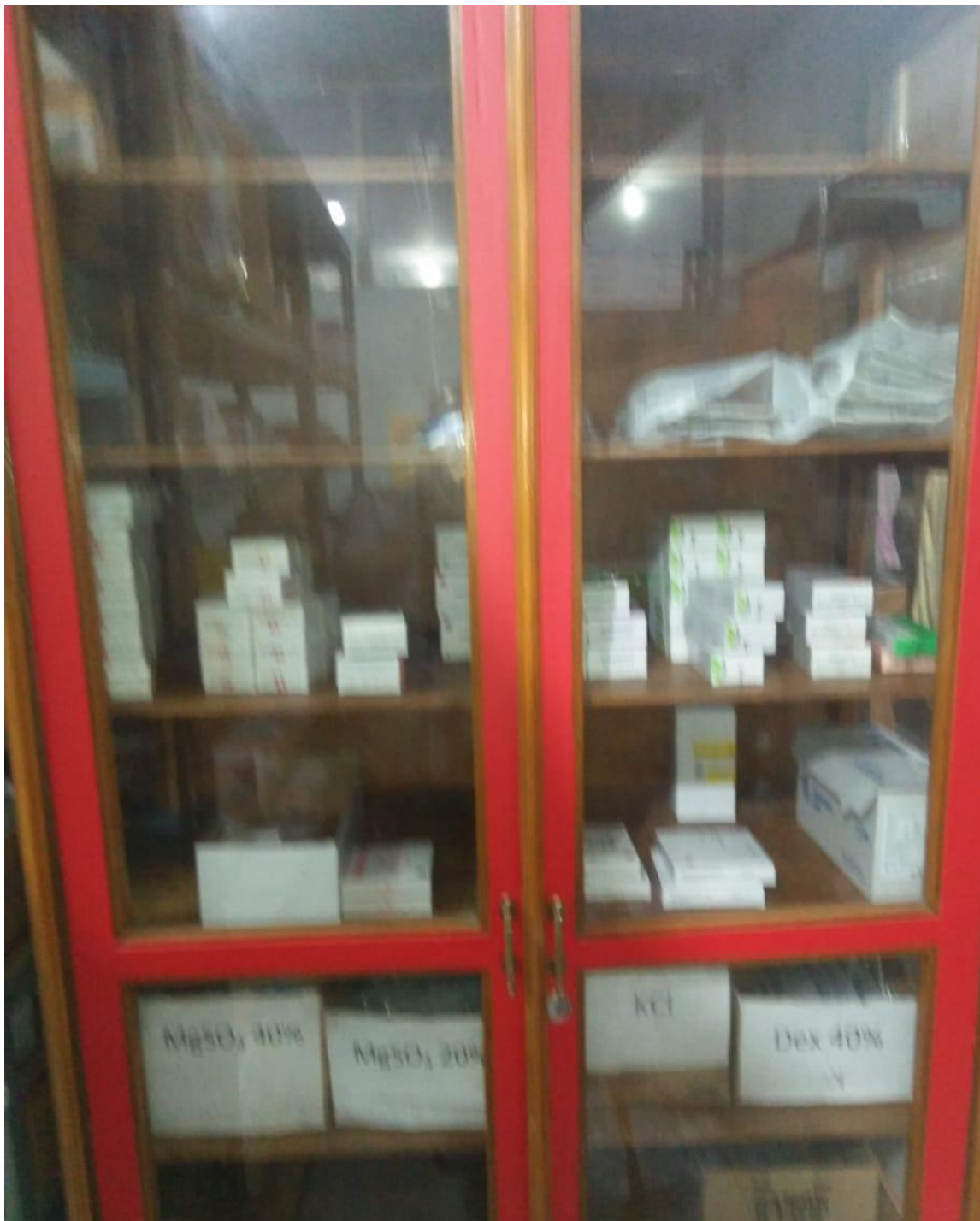
Lampiran III OBAT-OBAT GOLONGAN HIGH ALERT YANG ADA DI IFRS SALAH SATU RUMAH SAKIT SWASTA DI KOTA BANDUNG