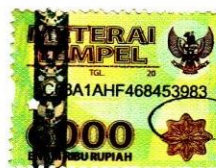
Yuli Yuliawati AK. 218039

Bandung, 5 Agustus 2020 Yang Membuat Pernyataan