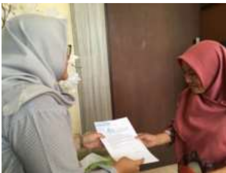
Gambar Dokumentasi Saat Responden Mengisi Lembar Kuesioner