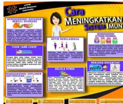
Gambar 2. Poster Edukasi tentang Sistem Imun

Poster maupun video edukasi tidak hanya dikirim via WAG warga namun juga dibagikan melalui account Instagram dan channel Youtube Fakultas Farmasi, Universitas Bhakti Kencana. Gambar 3 dan 4 merupakan salah satu contoh penyebaran melalui Instagram dan Youtube.