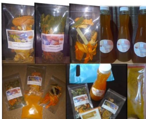
Gambar 5. Bahan baku dan Produk Herbal

Setelah warga melihat dan menonton konten edukasi, warga diberi kesempatan untuk mencoba dengan dibagikannya sampel bahan baku berikut contoh herbal jadinya.