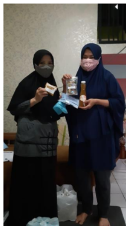
Gambar 6. Pemberian paket bahan dan masker kepada warga

Warga memberikan respon yang positif dan tertarik untuk mencoba mempraktekkan dan mengolah.