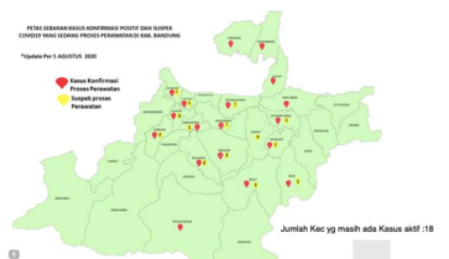
Gambar 1. Peta Sebaran kasus konfirmasi positif dan suspek COVID-19 di Kab. Bandung ( https://covid19.bandungkab.go.id/infografis , diakses 12 Agustus 2020, 23.32 WIB)

Sebagaimana yang kita ketahui, COVID-19 saat ini telah menjadi pandemi. Dalam masa Adaptasi Kebiasaan Baru, angka kejadian COVID-19 di Jawa Barat masih meningkat. Berdasarkan data dari https://pikobar.jabarprov.go.id update Rabu, 12 Agustus 2020, total terkonfirmasi sebanyak 7803, meningkat 109 kasus. Dari yang terkonfirmasi tersebut, masih ada 3016 kasus aktif (meningkat 37 kasus). Lima Kabupaten/kota di Jawa Barat yang menyumbang kenaikan kasus tertinggi di Jawa Barat salah satunya adalah Kabupaten Bandung, yang meningkat 164,4%. Gambar 1.1 berikut menunjukkan kasus aktif di Kabupaten Bandung.