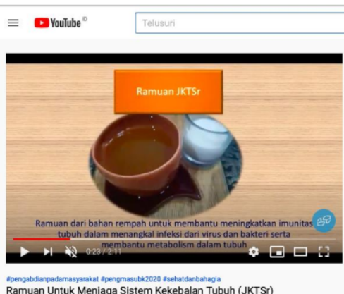
Gambar 4. Contoh penyebaran konten edukasi melalui channel Youtube

Penyebaran konten edukasi dan tutorial melalui platform media sosial tersebut lebih efektif dan efisien dibanding hanya mengirimkan file gambar poster atau video langsung di WAG. Warga mendapatkan kemudahan dengan mengklik link yang lampirkan, tanpa harus mendownload gambar dan videonya.