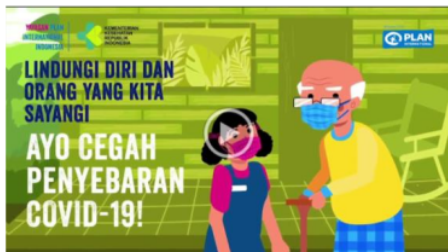
Gambar 1: Video 1 Penyuluhan Pencegahan COVID-19