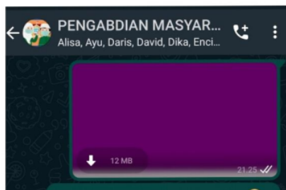
Gambar 4 : Grup Koordinasi Whatsapp