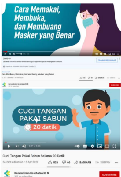
Gambar 3: Demonstrasi Cuci Tangan Pakai Sabun & Pemakaian Masker