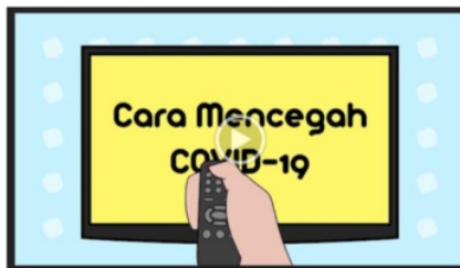
Gambar 2 : Video 2 Penyuluhan Pencegahan COVID-19